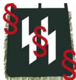
Doppelte "Sig"-Rune der SS - La doppia runa "Sig" delle SS

Tra la moltitudine di rune tramandate dall'epoca germanica, solo poche furono effettivamente utilizzate e strumentalizzate durante il nazionalsocialismo. La più conosciuta è la runa "Sig" come simbolo del "Deutsches Jungvolk" (DJ) e – come doppia runa "Sig" – anche come simbolo delle "Schutzstaffel" (SS) del NSDAP. Entrambi sono proibiti in Germania. L'origine della runa "Sig" è controversa, probabilmente corrisponde alla runa "Sowulo" (chiamata anche runa "Sol") come simbolo del sole.