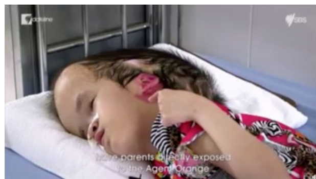
Vietnamesisches Kind mit Geburtsfehler, weil die Eltern dem Entlaubungsmittel Agent Orange ausgesetzt waren.