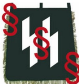
Doppelte "Sig"-Rune der SS - La doppia runa "Sig" delle SS

Tra la moltitudine di rune tramandate dall'epoca germanica, solo poche furono effettivamente utilizzate e strumentalizzate durante il nazionalsocialismo. La più conosciuta è la runa "Sig" come simbolo del "Deutsches Jungvolk" (DJ) e – come doppia runa "Sig" – anche come simbolo delle "Schutzstaffel" (SS) del NSDAP. Entrambi sono proibiti in Germania. L'origine della runa "Sig" è controversa, probabilmente corrisponde alla runa "Sowulo" (chiamata anche runa "Sol") come simbolo del sole.