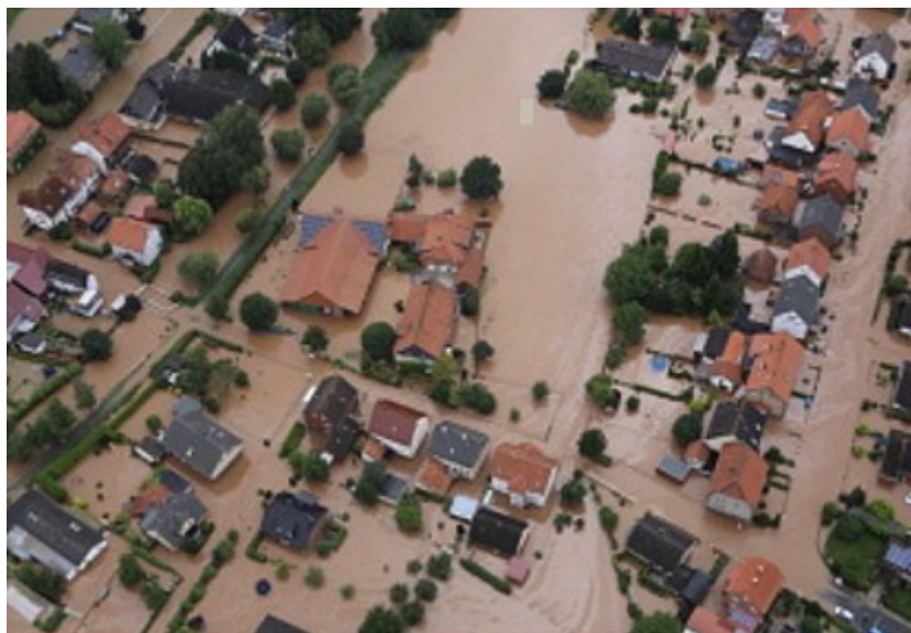
Hochwasser in Süd-Niedersachsen im Juli 2017 23,11 h

Semjase Sì, approssimativamente questo è l'ordine. Tuttavia, indipendentemente da come sia, il fatto oggi è che, a causa della colpa dell'intera umanità terrestre, molte terre emerse diventeranno lentamente, ma sicuramente, una palude e un pantano invasi dall'acqua, dove regneranno pestilenze e morte.