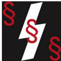
"Sig"-Rune - La runa 'Sig'

L' "alfabeto runico" (chiamato "Futhark" dalla sequenza delle prime lettere) ha subito cambiamenti nel corso del tempo, sia per quanto riguarda il numero dei caratteri che la loro forma e denominazione.